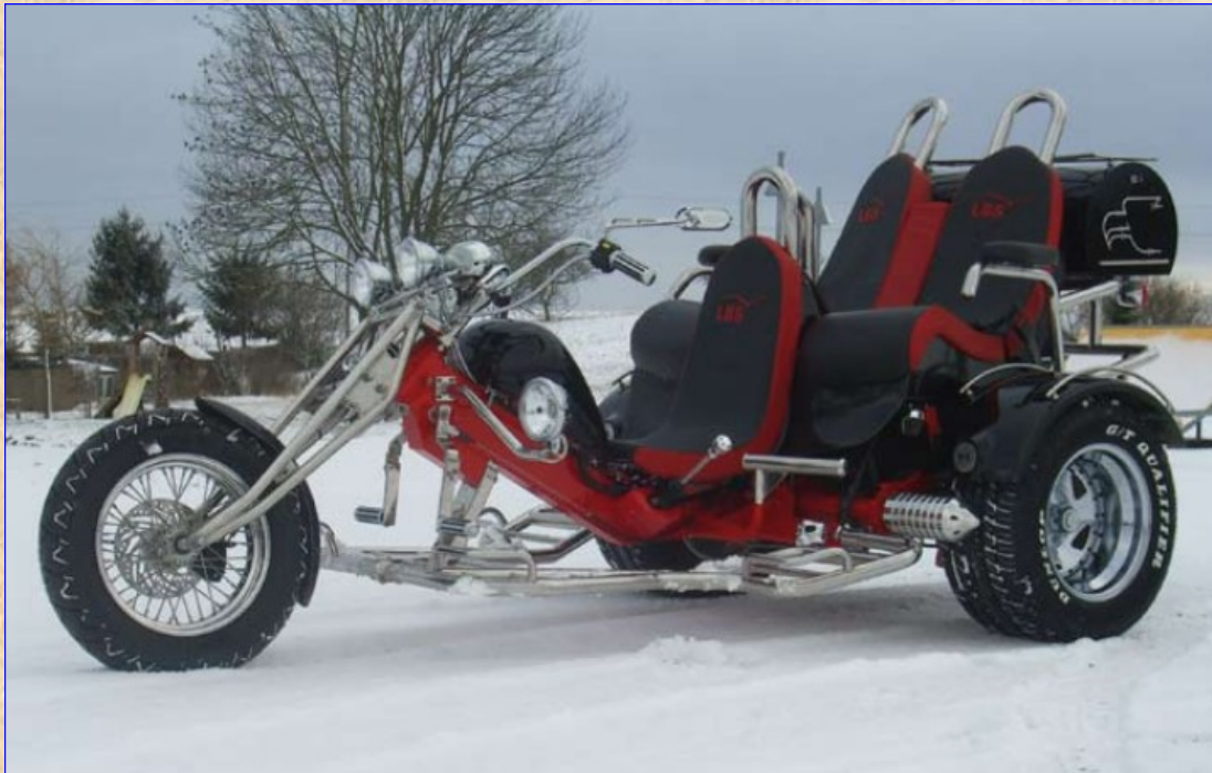
(Le modèle représenté sur la photographie comporte des options)