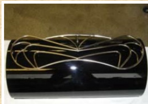
Coffre cylindrique "Magnum" avec porte bagages en inox (commande spéciale)