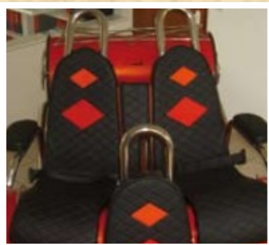
Ensemble de trois repose-têtes en inox et accoudoirs capitonnés